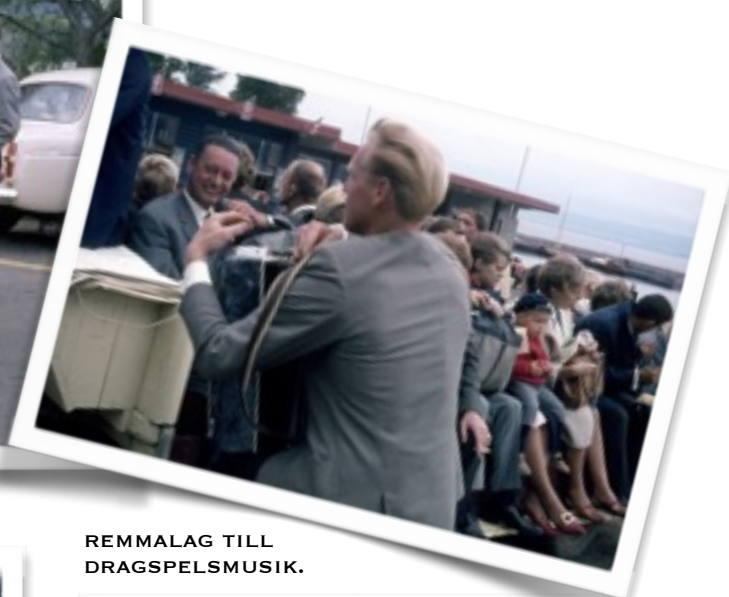
REMMALAG TILL DRAGSPELSMUSIK.