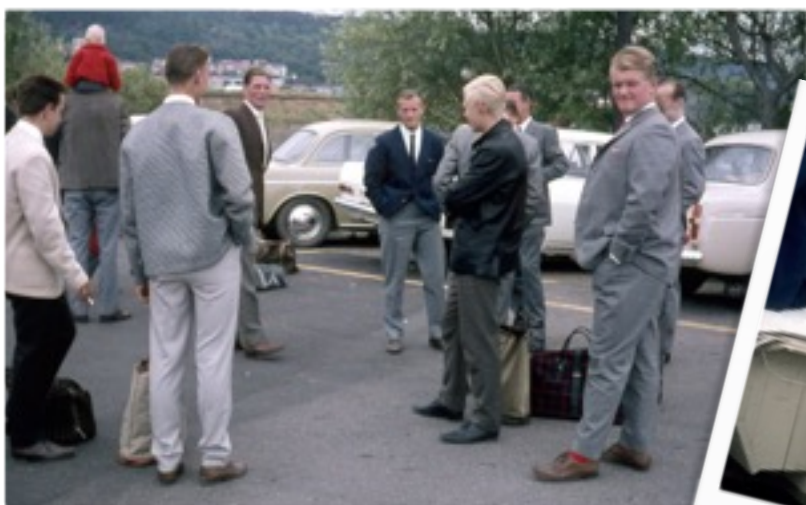
I GRÄNNA HAMN I VÄNTAN PÅ FÄRJAN.