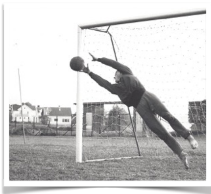
BILD 3. FANTOMRÄDDNING AV OKÄND MÅLVAKT.

Föreningsstyrelsen bestämde att ishockeysektionen fick disponera 6 timmars åkträning på konstisbana inne i stan, vilket sedan utökades till 8 timmar.