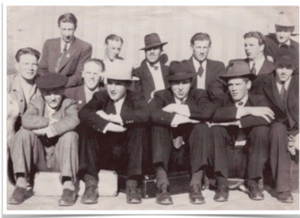
BILD 9. TENHULTS IF PÅ VÄG TILL BORTAMATCH NÅGON GÅNG PÅ 50-TALET KANSKE.