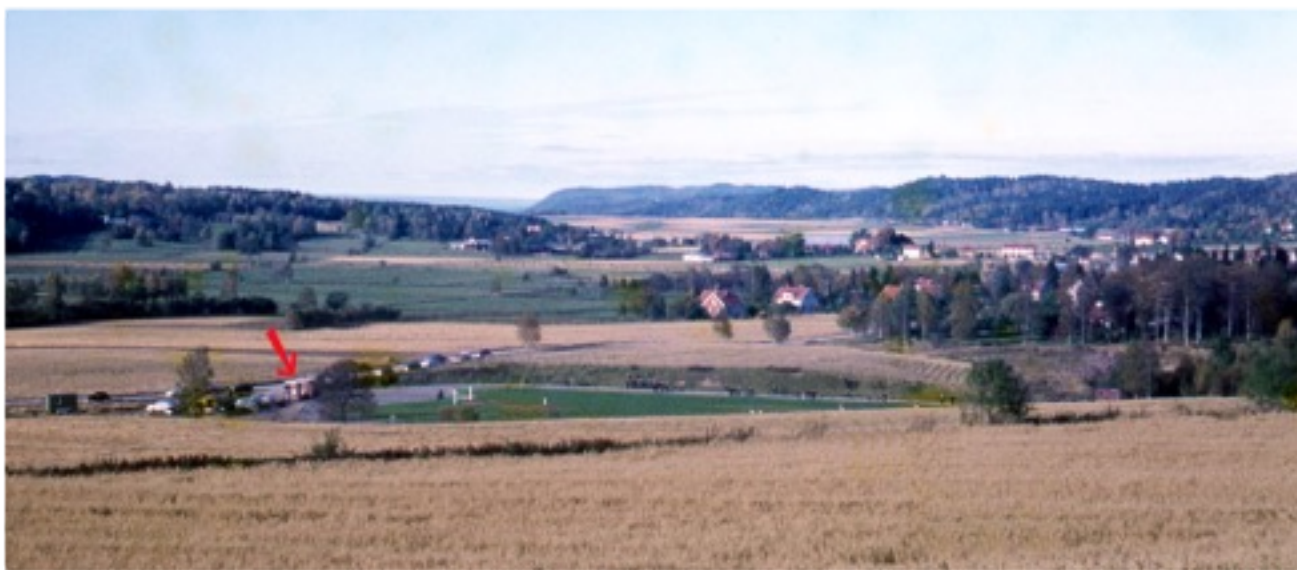
BILD 2. BILDEN ÄR TAGEN OMKRING 1965 UPPIFRÅN DET SOM NU ÄR BOSTADSOMRÅDET BACKSVALUVÄGEN OCH HÖGALUNDSVÄGEN. MAN SER HUVUDENTRÉN (RÖDA PILEN) OCH LÖPARBANAN KRING PLANEN. DET FINNS ÄNNU INGEN KLUBBSTUGA.

En turnering i kvartersishockey anordnades. Turnering gav ett överskott på 100 kr som användes till inköp av material till pojklaget i ishockeysektionen. Ishockey-sektionen försökte återigen bygga upp ett ishockeylag. Finansiering